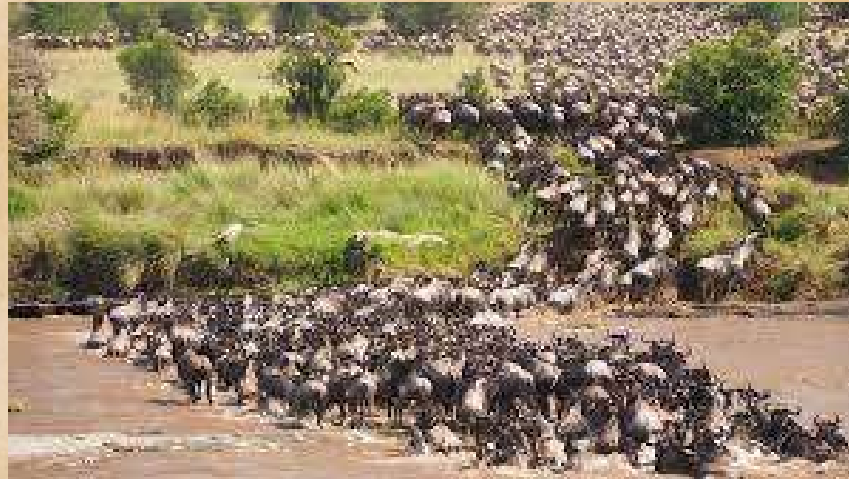
Tanzania: migrazione degli Gnu. Ad occhio e croce molte migliaia di animali

In alcune tecniche di cucito si usano due bastoncini per mantenere i fili in croce tra loro. Se si sfilano i bastoncini è impossibile recuperare i fili della tela in modo preciso ed allora si riparte “ad occhio”. Questa soluzione non è perfetta e viene chiamata “ad occhio e croce” indicando che è una soluzione approssimativa.